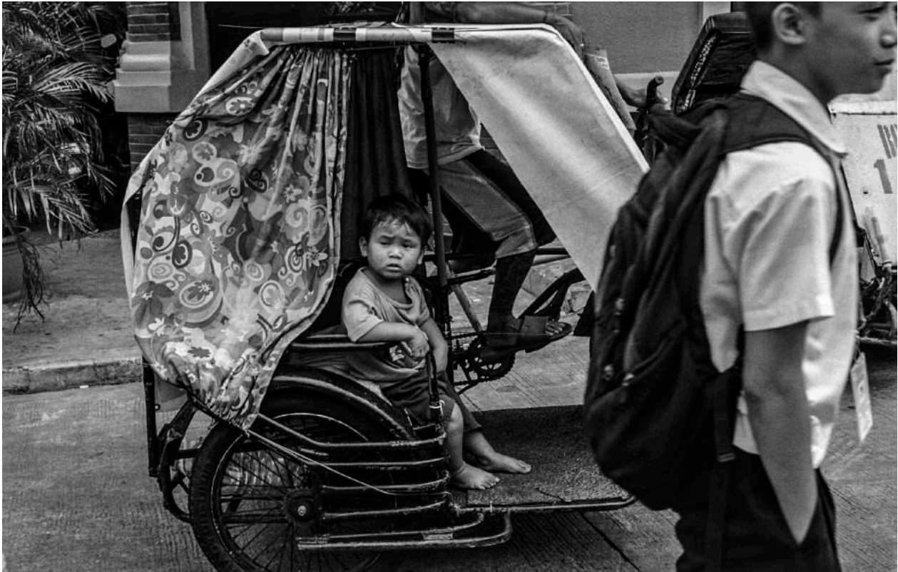
Mirta Rojo ©