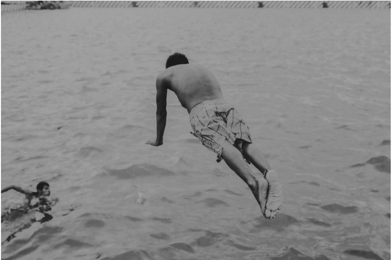
Álvaro Sancha ©