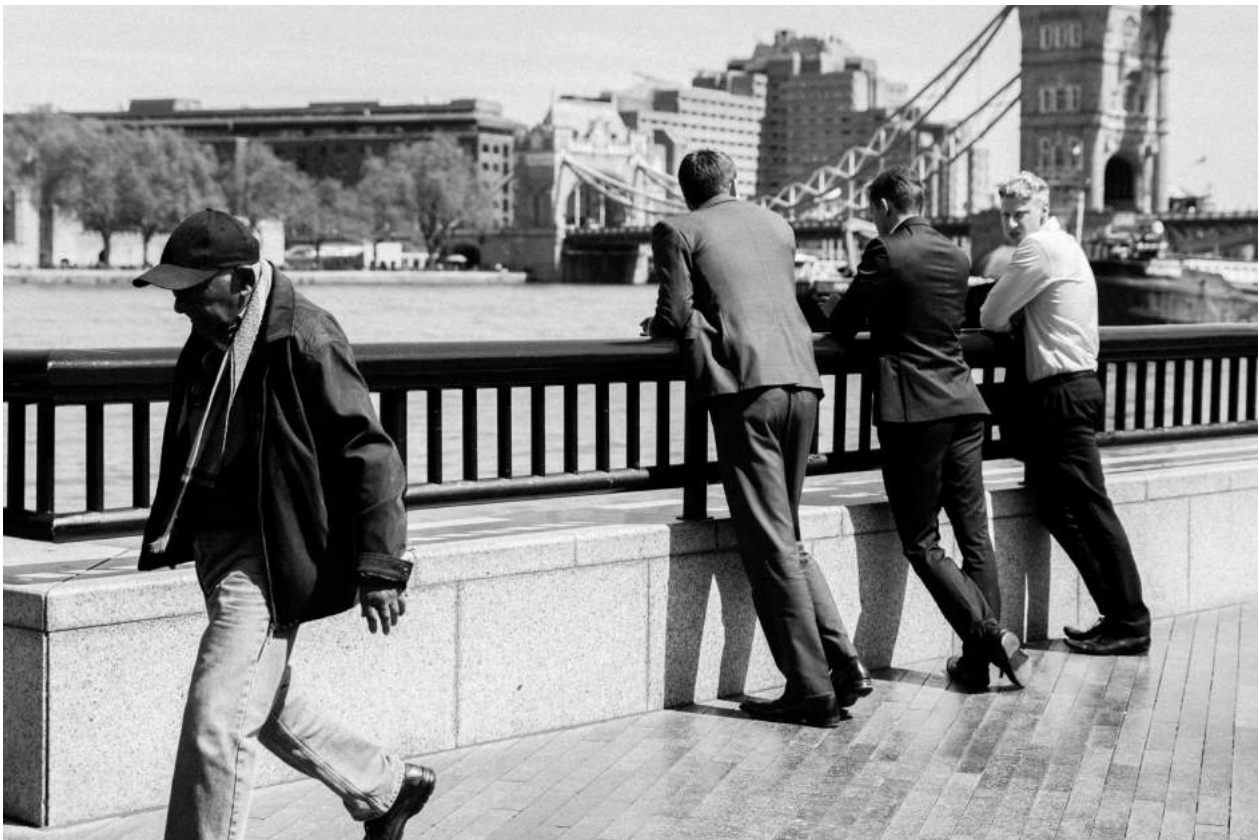
David Tordable ©